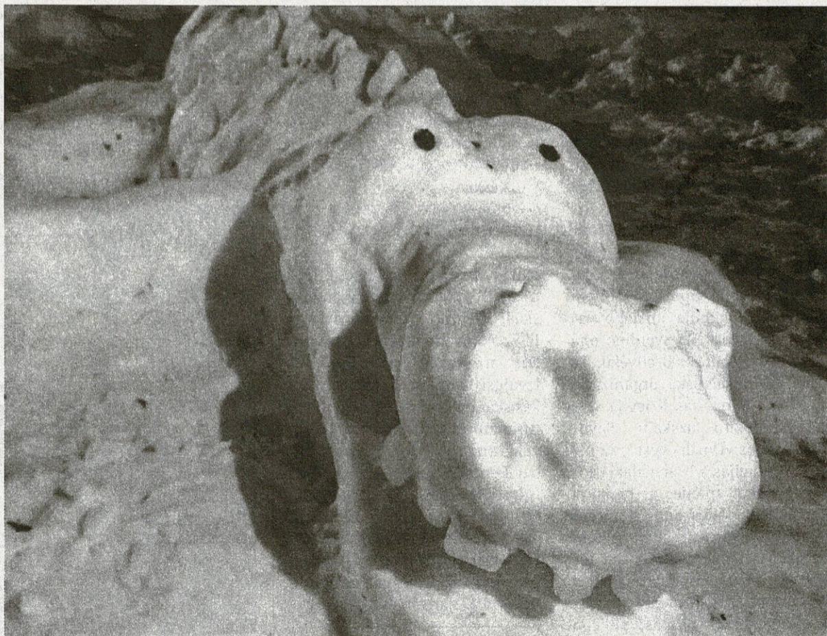
Žanetes Krieviņas veidotā figūra.